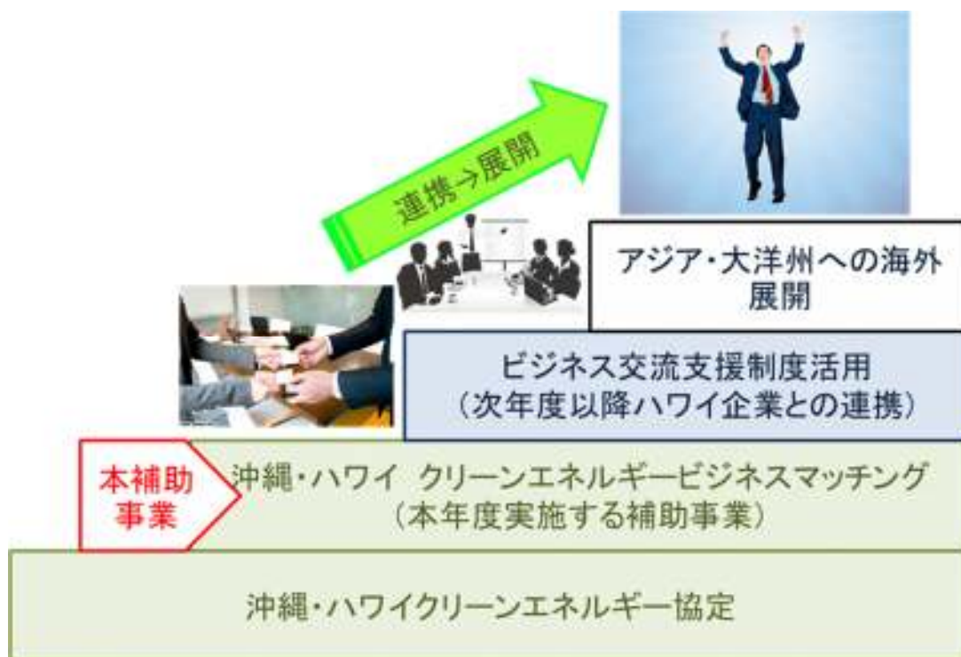
補助金のイメージ図